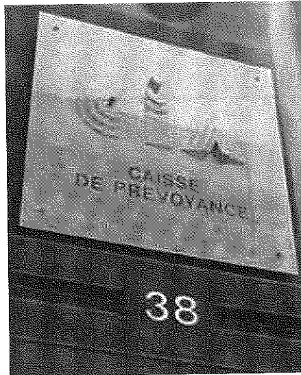
La CIA, au 38 boulevard Saint-Georges.

Fixer la priorité à la reconstitution des provisions pour fluctuation de valeurs et non