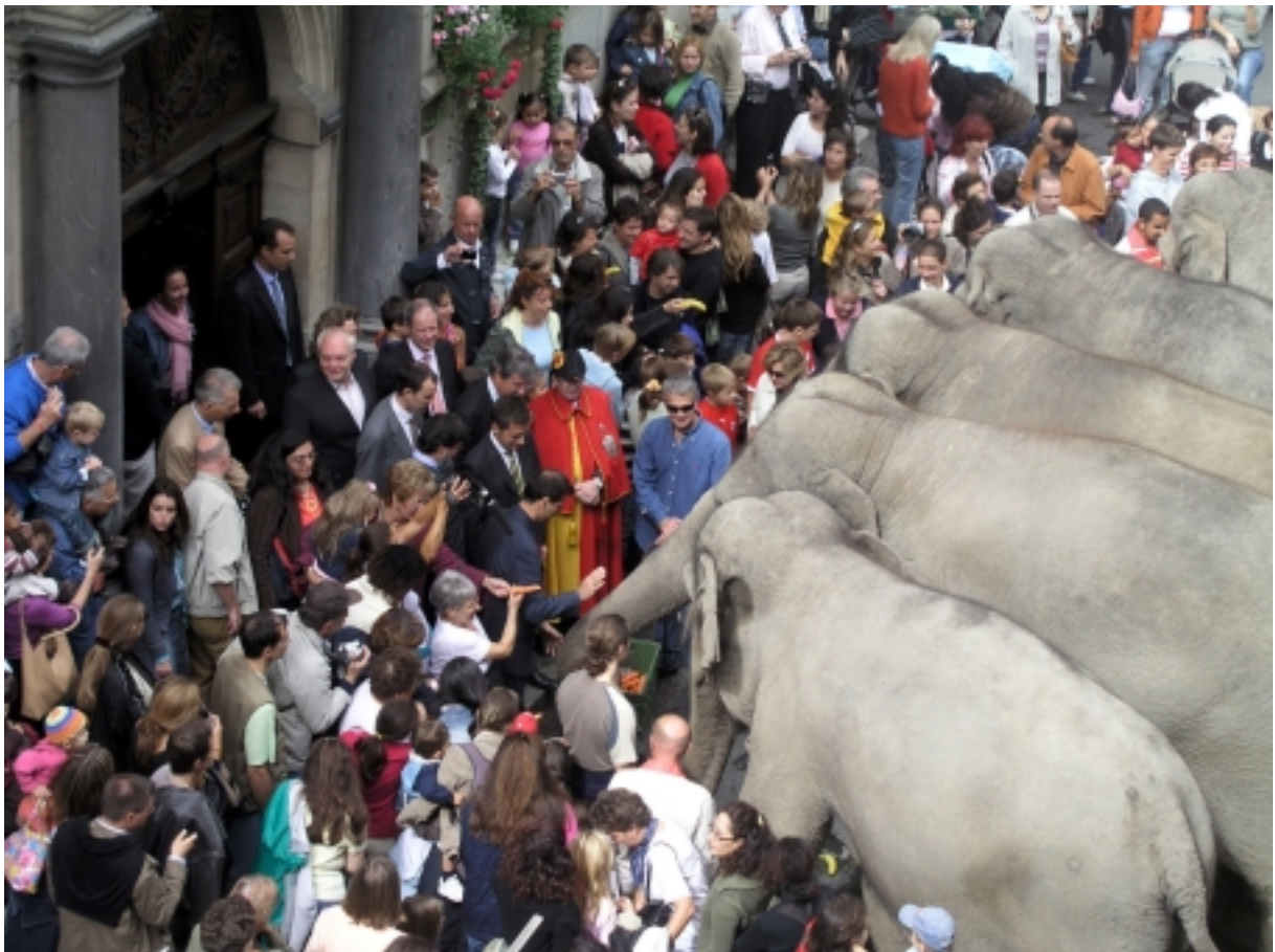
Le Conseil d'Etat accueillant le cirque Knie afin de parfaire son numéro de jonglage budgétaire !

Il faut corriger la péréquation ! L' Incidence financière qu'aurait eu la nouvelle péréquation intercantonale en 2001-2002, en millions de francs selon les projections.